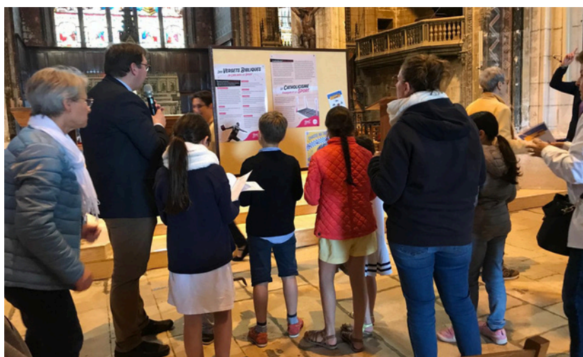
Avec la paroisse catholique, A Saint André, inauguration le 2 juin de l'exposition olympique